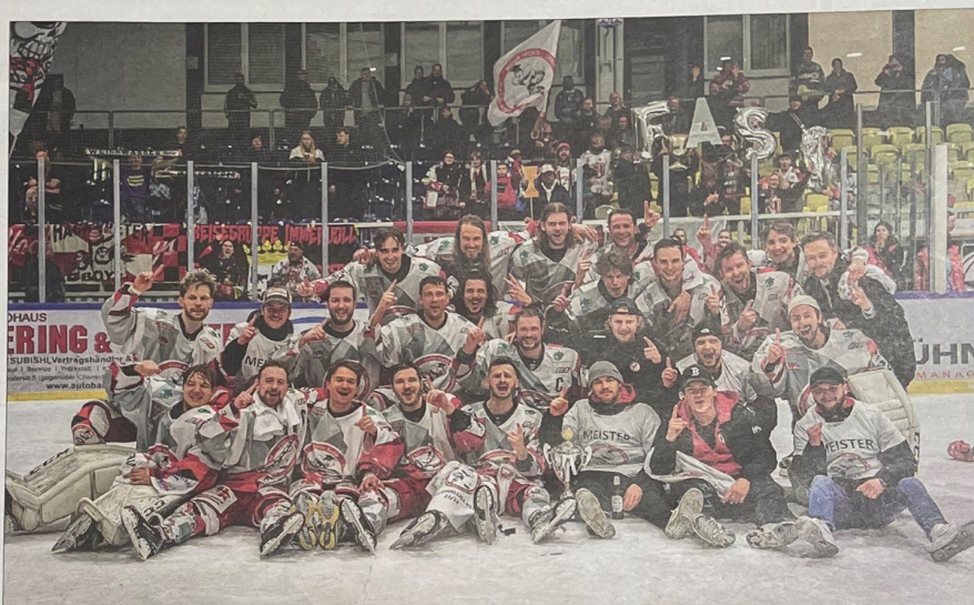
Die ersten Feierlichkeiten fanden schon im Eissportzentrum Küchwald in Chemnitz statt.

FASS Berlin feiert den Regionalliga-Titel am 27. April mit den Fans